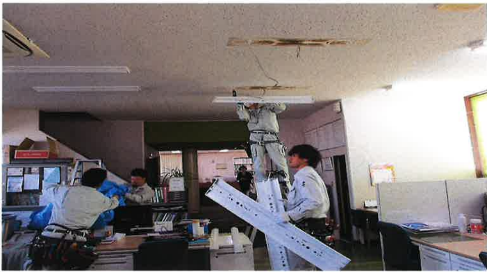
平成31年4月15日 事務所内LEDに交換作業状況