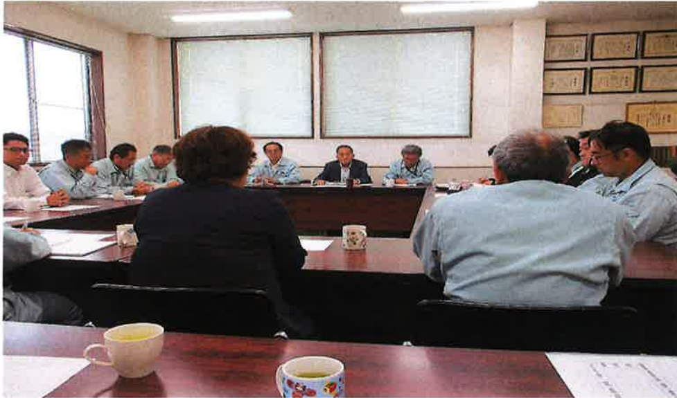
2019年度環境実施計画及び目標に説明